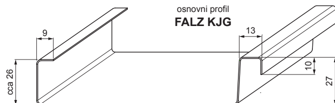
osnovni profil FALZ KJG