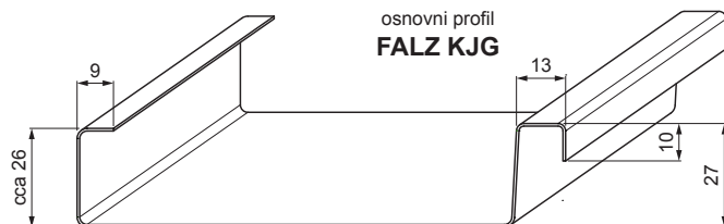
osnovni profil FALZ KJG