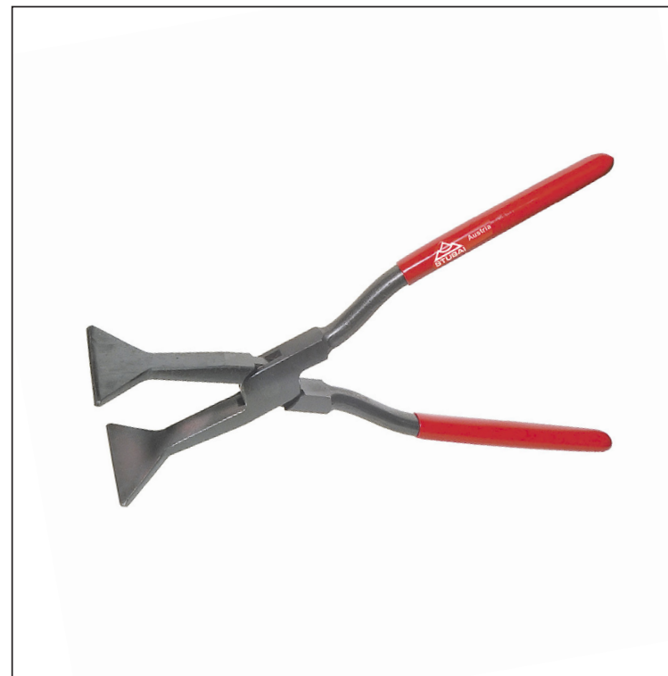
Uglični čelik C45