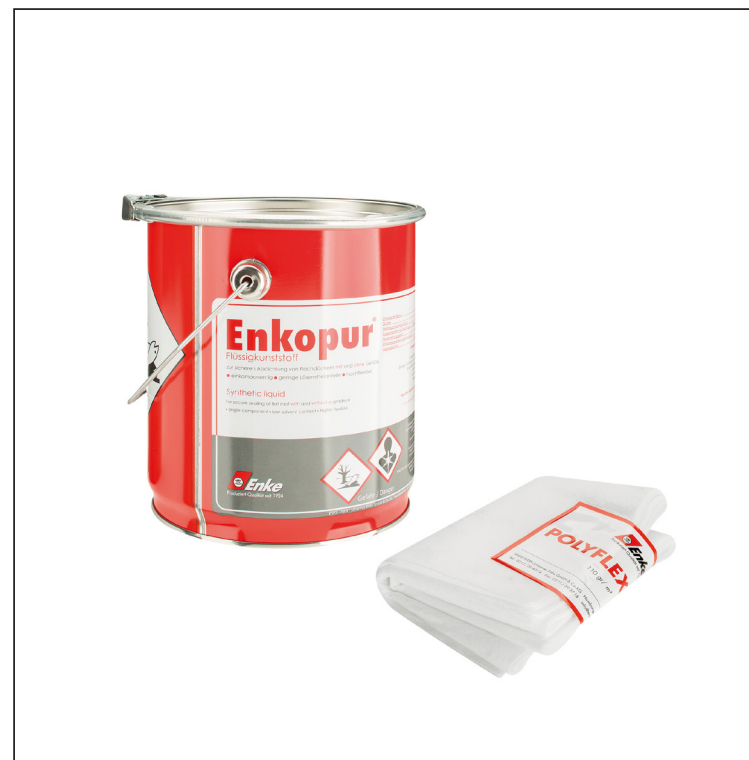
Enkopur : Poliuretanska smola – Siva Polyflexvlies: Poliester – Bijela