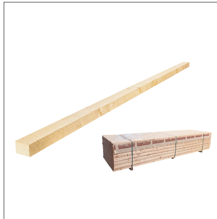
Uporaba za letvanje: