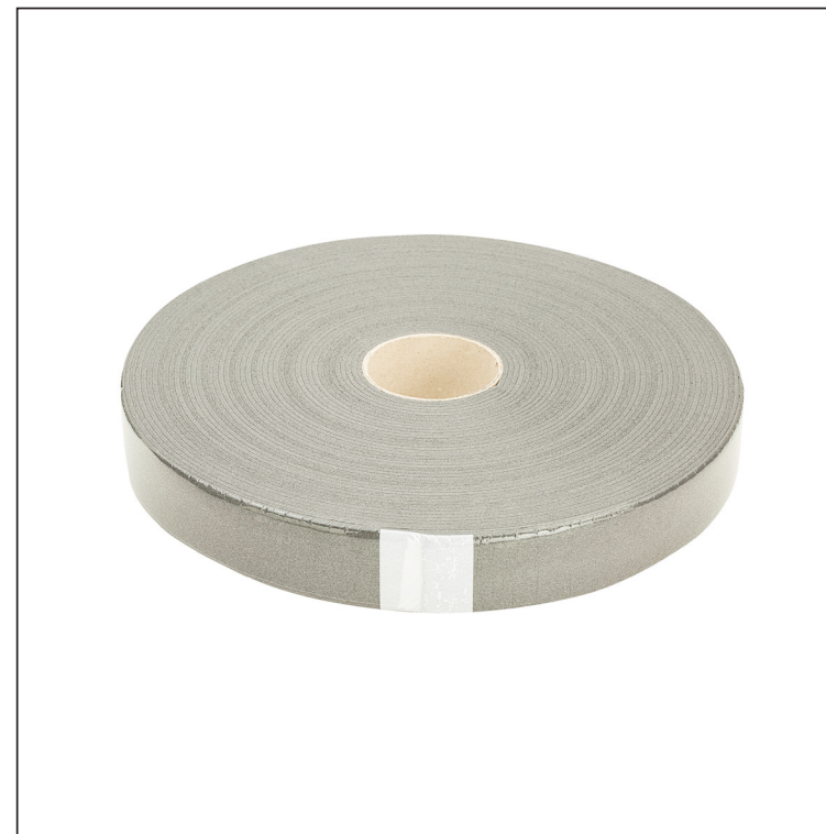
Polietilenska traka sa zatvorenim ćelijama

Jednostrana pjenasta polietilenska traka sa zatvorenim ćelijama obložena akrilnim disperzijskim ljepilom. Namijenjena za upotrebu kao brtvena traka u krovopokrivačkim i građevinskim radovima. Elastična struktura omogućuje izravnavanje kontralata postavljenog na krovnu membranu.