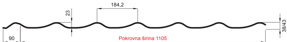
L – OPTIMALNA DULJINA POKROVA ZA MODUL 350 mm