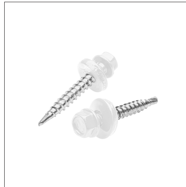
B Pocink obojeni – Bijela – RAL 9010