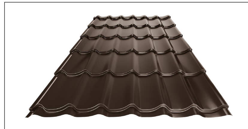
L – OPTIMALNA DULJINA POKROVA ZA MODUL 350 mm