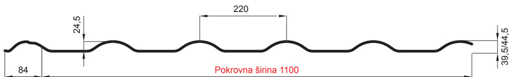
L – OPTIMALNA DULJINA POKROVA ZA MODUL 350 mm