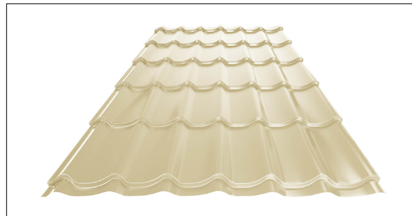
L – OPTIMALNA DULJINA POKROVA ZA MODUL 350 mm