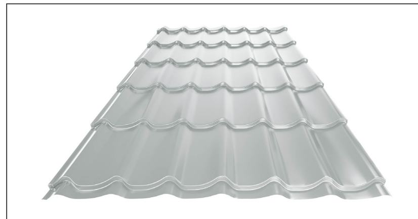
L – OPTIMALNA DULJINA POKROVA ZA MODUL 350 mm