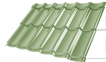
L – OPTIMALNA DULJINA POKROVA ZA MODUL 350 mm