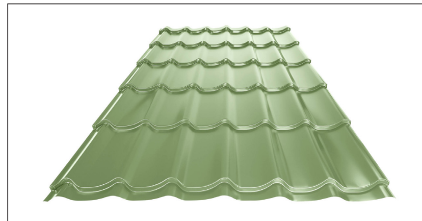
L – OPTIMALNA DULJINA POKROVA ZA MODUL 350 mm