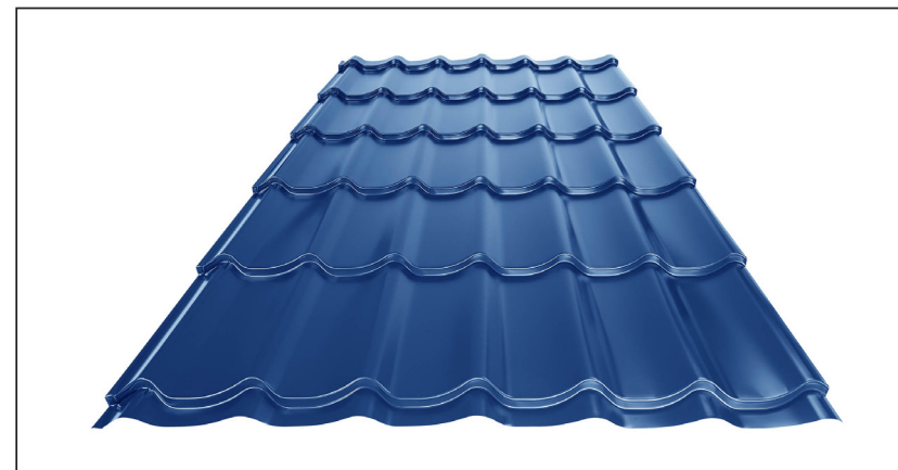
L – OPTIMALNA DULJINA POKROVA ZA MODUL 350 mm