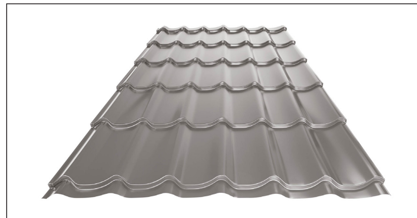
L – OPTIMALNA DULJINA POKROVA ZA MODUL 350 mm